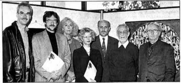
Die Arbeitsgemeinschaft Siegerländer Künstler stellt im Ratssaal aus.

Im kommenden Jahr wird es übrigens eine Gegenausstellung von Künstlern geben, bei der die Siegerländer Arbeitsgemeinschaft das Forum für Kunstschaffende aus dem Kreis Olpe bieten wird.